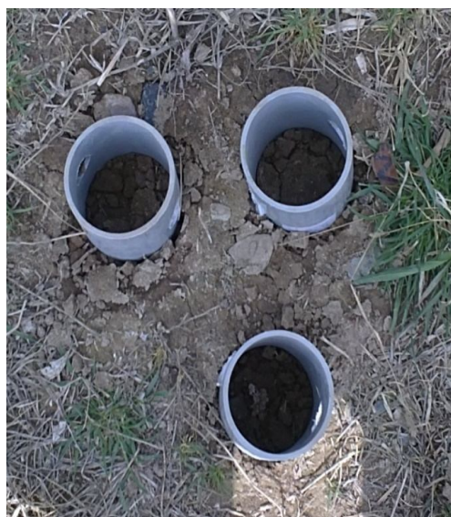
شکل 1- تهیه نمونه‌های خاک دست‌نخورده (با سه تکرار) با فرو کردن لوله‌های استوانه‌ای از جنس PVC در خاک

ساعت اشباع شدند، سپس به آن‌ها زمان داده شد (24 تا 48 ساعت) تا آب ثقیلی از انتهای ستون‌ها تخلیه شود.