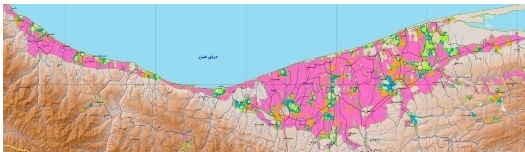
شکل 2- پراکنش منگنز قابل استفاده (استخراج شده با DTPA) در خاک‌های میانه و شرق استان مازندران. مناطق زرد رنگ، 1-0 میلی گرم در کیلوگرم؛ آبی کمرنگ، 2-1 میلی گرم در کیلوگرم؛ صورتی کمرنگ، 4-2 میلی گرم در کیلوگرم؛ سبز، 6-4 میلی گرم در کیلوگرم؛ آبی پررنگ، 10-6 میلی گرم در کیلوگرم؛ نارنجی، 15-10 میلی گرم در کیلوگرم و صورتی پررنگ بیش از 15 میلی گرم در کیلوگرم، منگنز قابل استفاده را نشان می‌دهند (طهرانی و همکاران، 1390)

رستم کلا، بهشهر، علمدارمحل و گلوگاه بین 10 تا 15 درصد کربنات کلسیم معادل دارند. بیشتر بخش‌های جنوبی آمل، نجارمحل، کیاکلا، بهنمیر، کوهی خیل و گلبرگ بین 10 تا 20 درصد کربنات کلسیم معادل دارند. اما بخش‌های عمده‌ای از ساری مانند آکند، زردگاه، تازه‌آباد ساری، طوس‌کلا و زاغمرز بین 20 تا 30 درصد کربنات کلسیم معادل دارند (شکل 3). همچنین مطالعات خاکشناسی باغ‌های مرکبات مناطق شرق مازندران نشان داده است که مقدار کربنات کلسیم خاک باغ‌های این منطقه از میانه به طرف شرق به تدریج افزایش می‌یابد به طوری که مقدار کربنات کلسیم خاک در آمل و بابل کمتر از یک درصد و در شرق ساری و نکا به بیشتر از 30 درصد می‌رسد (اسدی کنگرشاهی و اخلاقی امیری، 1393؛ طهرانی و همکاران، 1390).