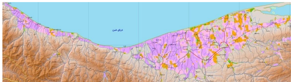
شکل 4- پراکنش ماده آلی در خاک‌های میانه و شرق استان مازندران. مناطق با رنگ زرد، 0/25 - 0 درصد؛ سبزروشن، 0/5 - 0/25 درصد؛ سبز، 0/75 - 0/5 درصد؛ قرمز، 1 - 0/75 درصد؛ صورتی، 2 - 1/5 درصد و بنفش بیش از 2 درصد ماده آلی را نشان می‌دهند (طهرانی و همکاران، 1390).

مقدار ماده آلی خاک‌های منطقه نیز از غرب به طرف شرق، به تدریج کاهش می‌یابد به طوری که بخش عمده خاک‌های مناطق غرب و میانه مازندران (رامسر، تنکابن، نشتارود، چالوس، نوشهر، محمودآباد، فریدونکنار و بخش‌هایی از بابلسر) دارای 2 درصد و بیشتر ماده آلی هستند. در مقابل، بخش عمده خاک‌های عباس‌آباد و سلمان‌شهر دارای ماده آلی کمتر از 2 درصد (بین 1/5 تا