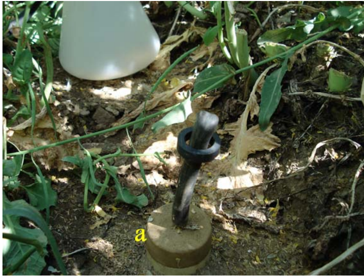
شکل ۱- (a) دستگاه Soil Water Sample برای تهیه نمونه زه‌آب