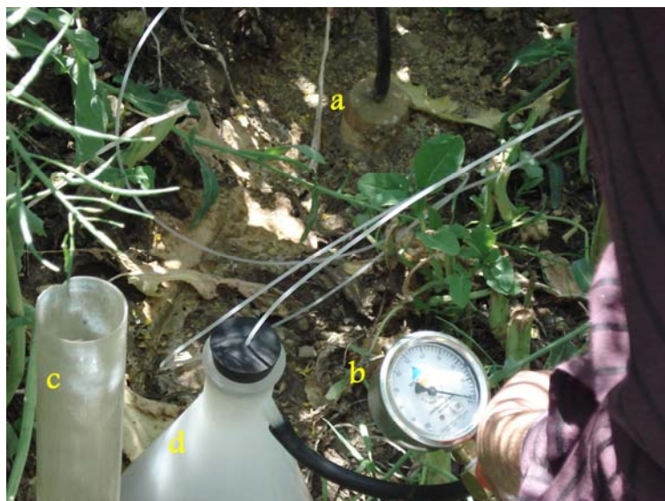
شکل ۲- وسایل نصب شده به منظور کنترل رطوبت و تهیه نمونه زه‌آب a = Soil Water Sampler; b = Vacuum Hand Pump; c = tube of T.D.R.; d = Vessel of collection.